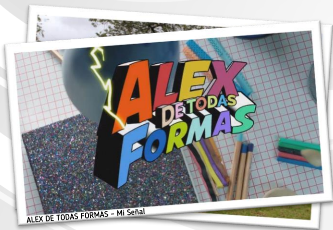
ALEX DE TODAS FORMAS - Mi Señal

La invitación es a acompañar a Mi Señal en la Feria de Libro el 3 de mayo a la 1:00 pm en el gran Salón Ecopetrol Sala Filbo A