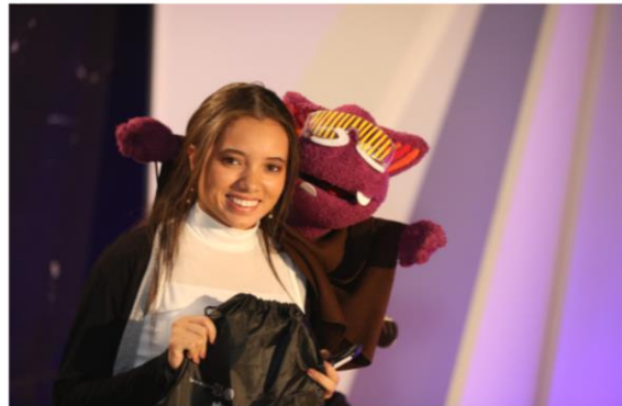
Estudiante Universidad INSTEL - Día de Estreno - #Miprimer Millón