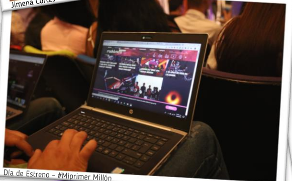
Día de Estreno - #Miprimer Millón