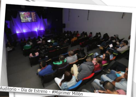
Auditorio - Día de Estreno - #Miprimer Millón