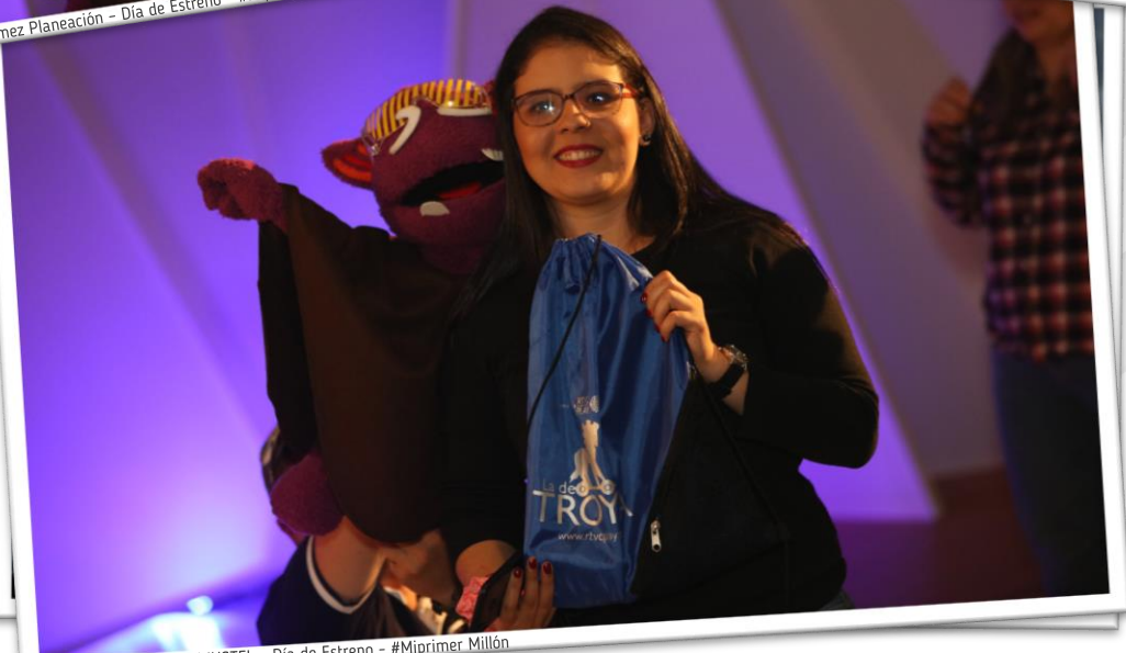
Estudiante Universidad INSTEL - Día de Estreno - #Miprimer Millón