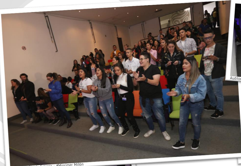
Auditorio - Día de Estreno - #Miprimer Millón