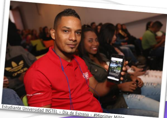
Estudiante Universidad INSTEL - Día de Estreno - #Miprimer Millón