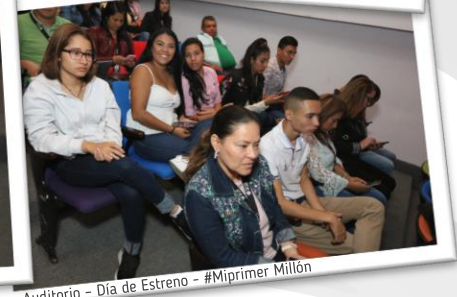
Auditorio - Día de Estreno - #Miprimer Millón