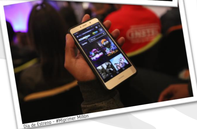
Día de Estreno - #Miprimer Millón